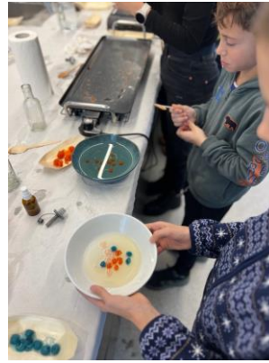
DELAVNICA ZA OTROKE: Molekularna kuhinja -foto zgoraj desno Koprodukcija: Center Rog, WIT Uroš Novak

Na delavnici so otroci izdelali užitne sladkorne paketke iz naravnih polimerov. Spoznali so novo vrsto bioplastike, ki je popolnoma naravna in jo je mogoče tudi jesti, s čimer otrokom pokažemo, da je naša prihodnost lahko tudi brez okolju škodljive plastike. Otroci so biopolimerom dodajali naravna barvila in okuse ter vanje pakirali sladke in medene dobrote.