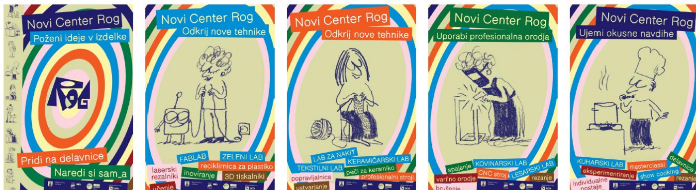
Plakati TAM TAM

Uporabili smo serijo plakatov TAM TAM, ki so bili razporejeni po ključnih lokacijah v mestu. Plakati so oblikovno izstopali in vsebovali kreativne elemente, ki so mimoidoče spodbujali k razmisleku o tem, kaj ponuja Center Rog.